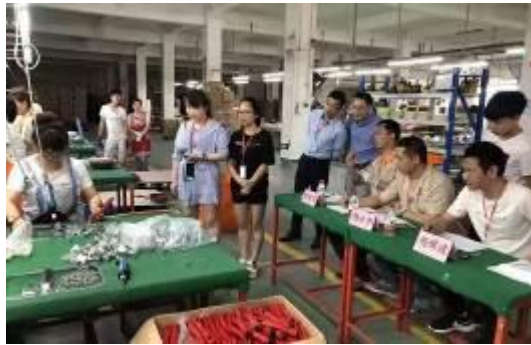
图 9 组装工序技术比武

群众性质量管理活动坚持“广泛动员、全员参与”原则，以普通一线员工为质量创新的“主力”，将 QC 小组、合理化建议、现场管理作为公司全员质量活动的平台，通过各类技术比武、合理化建议排名等活动激发员工参与热情。公司提供各项活动所需的资源，并通过对活动成果评定、认可和激励员工参与质量管理活动的积极性。