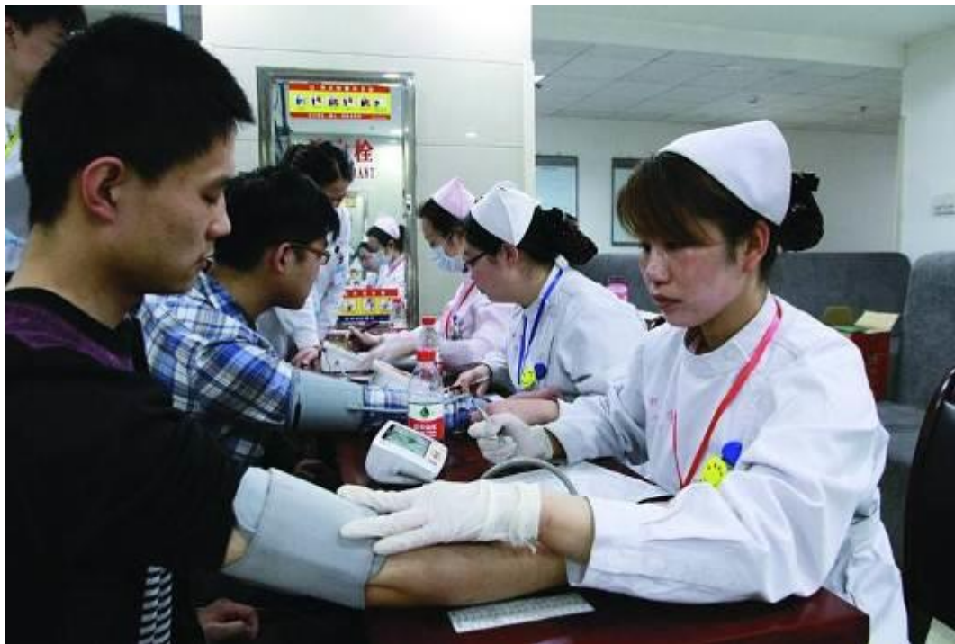
图 5 员工体检