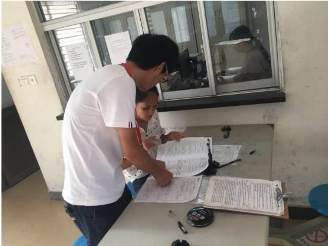
图 4 签订劳动合同