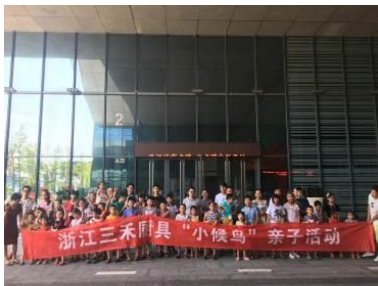
图 7 “小候鸟”亲子活动

公司给员工建立舞蹈、健身、乒乓球、台球等活动室，推行快乐工作：为改变员工工作态度，提高工作积极性，把工作与生活紧密相连，使员工能在工作中得到更多的快乐。