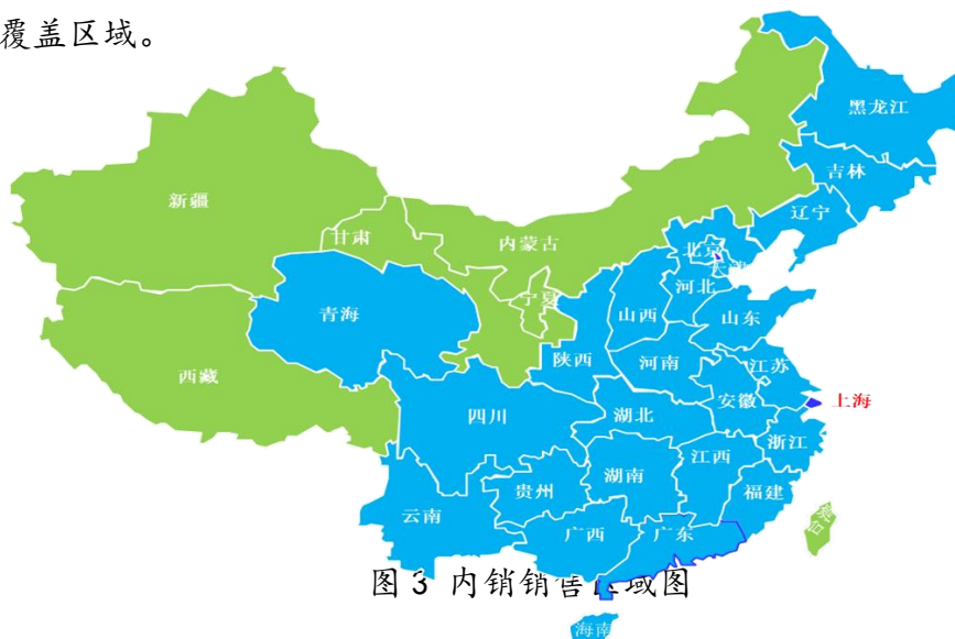
图 3 内销销售区域图

内销遍布全国各地城市，除了甘肃、新疆、西藏、内蒙，具体分布图见图 3 所示，标蓝色的为覆盖区域。